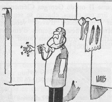
— Passez-moi votre machin, docteur, je le placerai moi-même ! (Dessin de Valls-Cosmopress).

N'hésitez pas à nous solliciter, même pour un simple renseignement. Chaque demande fait l'objet d'une attention particulière et confidentielle.