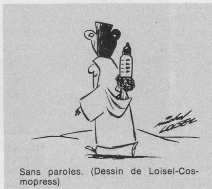
Sans paroles. (Dessin de Loisel-Cosmopress)

Le plus simple serait qu'elle obtienne l'accord écrit de son mari. Si celui-ci ne le lui donne pas de son plein gré, votre fille pourra s'adresser au juge qui lui donnera l'autorisation de demeurer en Suisse avec son enfant.