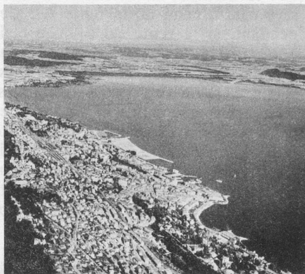
Neuchâtel, vue aérienne

Quelques places sont encore disponibles pour ces vacances, du 27 octobre au 10 novembre 1977. Pour réserver, téléphoner au (021) 22 34 29.