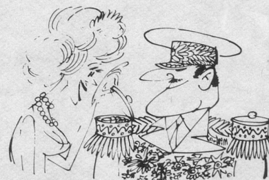
Pralinés ! (Dessin de Moese-Cosmopress)

Les groupes du 3 e âge pourront donc annoncer leur venue par un simple avis, donnant l'heure de leur arrivée en train ou en car, adressé à « ADC, 2088 Cressier (NE) ». Cette adresse suffit. Les participants seront accueillis dès leur arrivée par un membre de l'ADC qui leur remettra un plan commenté du village, leur permettant de s'y promener à leur guise, de visiter l'exposition, d'assister à une présentation avec diapositives d'un « Pays de vignoble », de recevoir un catalogue-loterie (les lots sont magnifiques !), de prendre à 15 h. 45 une collation (boisson et cake) dans un établissement du village, le tout pour Fr. 5.— seulement ! Cressier se réjouit d'accueillir en toute simplicité, mais de tout cœur, ceux qui auront l'excellente idée de passer quelques heures dans ce sympathique village viticole.