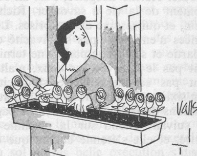
— Entre, je suis au jardin ! (Dessin de Valls-Cosmopress)

Le magasin en question est responsable à votre égard de la bonne exécution de la réparation que vous lui avez confiée. Vous n'avez pas le droit d'exiger le remplacement de l'appareil. En revanche, vous pouvez le rapporter et demander qu'on vous le répare à nouveau, et cela gratuitement.