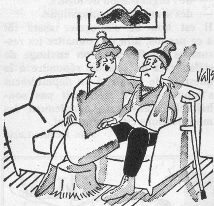
— Ça me rappelle notre voyage de nocces ; nous ne nous quittons pas d'une semelle ! (Dessin de Vallis, Cosmopress)

Compte tenu des objectifs que nous nous sommes fixés visant à lutter contre les risques d'isolement de cer-