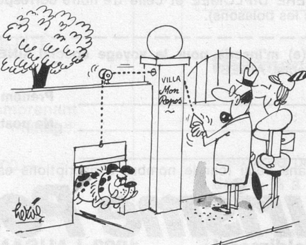
Sans paroles. (Dessin de Hervé-Cosmopress.)

En ce qui concerne l'arbre lui-même, et si vous habitez le canton de Vaud, ce sont les règles du Code rural qui s'appliquent. Si l'arbre est situé à moins d'un mètre de votre limite, vous pouvez exiger qu'il soit abattu. S'il est implanté à une distance située entre un et trois mètres, l'arbre ne doit pas avoir une hauteur supérieure à deux mètres ; s'il se trouve à une distance située entre trois et six mètres, l'arbre ne doit pas avoir une hauteur supérieure à six mètres. S'il dépasse ces hauteurs, vous pouvez exiger de votre voisin qu'il l'écime pour le ramener à la hauteur légale.