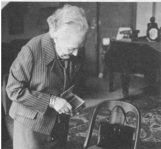
Un petit cigare.