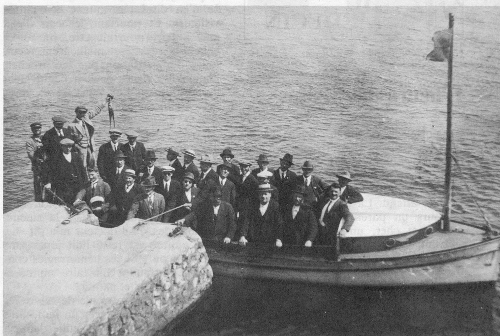
Retour de l'excursion au Château-d'If, nous ramenons une petite pieuvre.