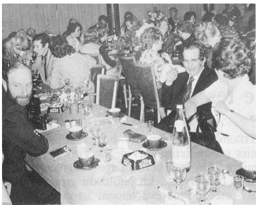
Vue très partielle de l'assistance en grande majorité composée de gracieuses aides au foyer.

esprit de service auprès de leur prochain. Avec une rémunération de Fr. 1.50 par heure, les dix premières aides au foyer se mirent au travail. » Le Service a implanté ses racines de façon fort modeste, sans bureau ni machine à écrire, en premier lieu dans l'appartement de Mlle Brun, jusqu'à fin 1963. Le 1er janvier 1964, l'Aide au foyer est descendue avenue Ruchonnet 20, en même temps que je descendais des hauteurs enneigées du Jura où, laissant mon travail d'aide familiale, je reprenais les rênes de ce service : à cette date, 30 aides au foyer travaillaient.