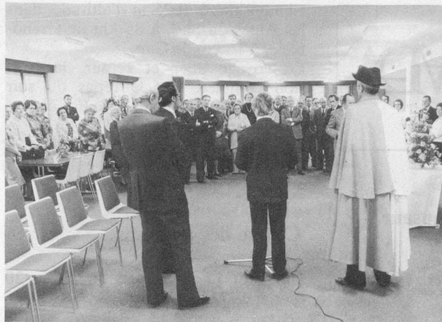
Le Club du Seujet compte déjà 420 membres qui passeront de belles heures d'amitié dans ce magnifique local et dans ses dépendances magnifiquement aménagés.

Après ceux de la Jonction, des Pâquis, des Asters, de Plainpalais, des Eaux-Vives et de Vieusseux, le club du quai du Seujet est le 7e de la ville de Genève. Il est avant tout destiné aux habitants des quartiers Saint-Jean-Charmines-Seujet qui le souhaitent ardemment. Deux autres clubs sont