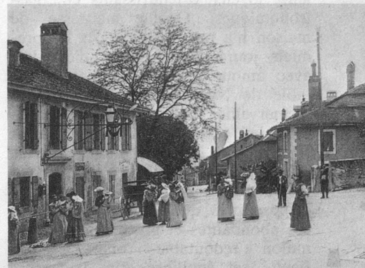
Bursins en 1907.