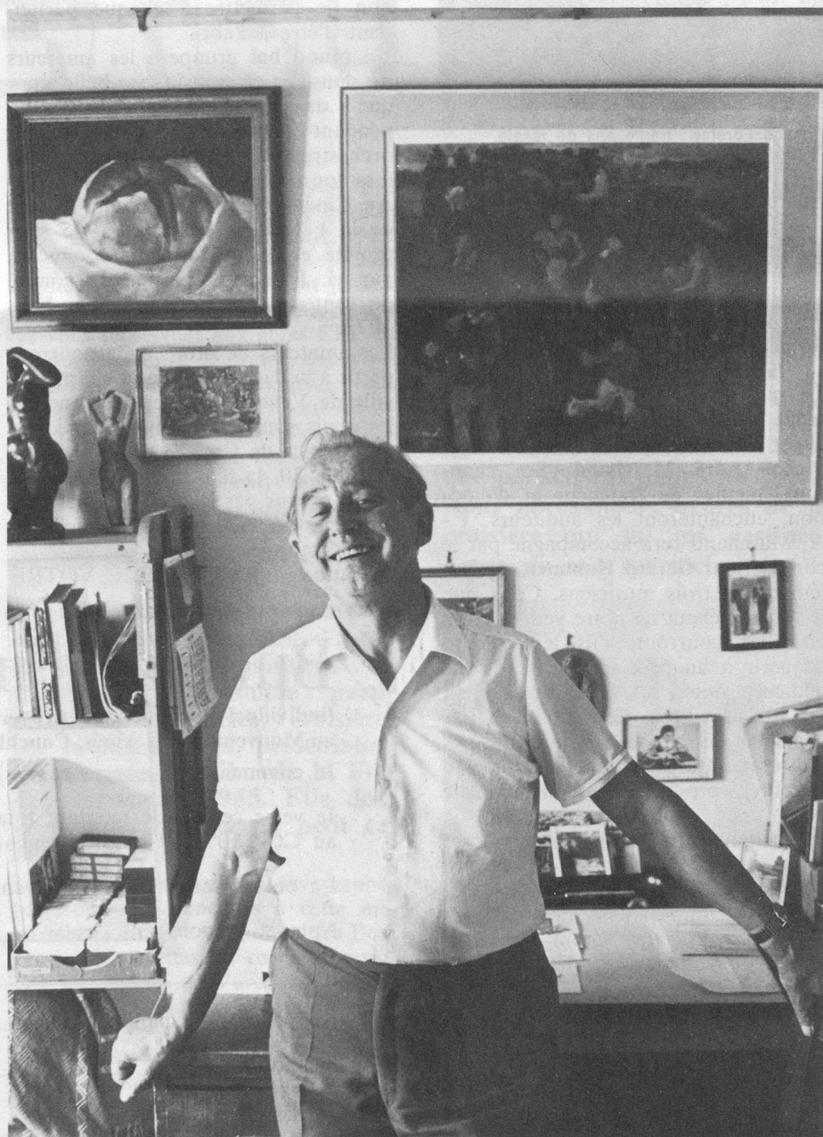
L'optimisme d'une « retraite » heureuse.

Issu d'une famille modeste — son père était chef de gare à Bercher — il vit toujours dans la maison blanche, entourée de fleurs et d'arbres, qui le vit naître. Il raconte : « La gare de Bercher était alors importante : Nestlé exploitait une fabrique de lait condensé dans le village. Nous étions trois enfants. J'en ai moi-même deux. Ils sont grands... Mon père ne s'intéressait ni à la peinture, ni à la gymnastique. J'ai suivi mes classes à Bercher, en Suisse allemande et à Lausanne, à l'Ecole normale. En 1925,