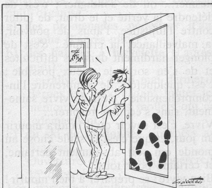
— Notre voisin est venu hier soir rouspéter pendant notre petite fête ! (Dessin de Sabatès.)

Réponse. Les règles et usages locatifs du canton de Vaud prévoient qu'il est interdit d'incommoder les voisins