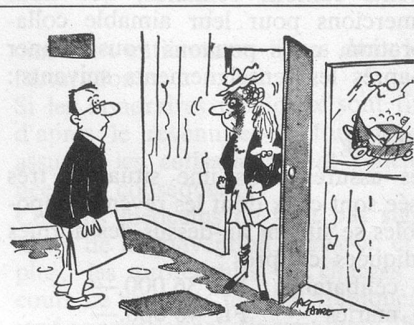
— Devine ce qui est arrivé au réverbère au coin de la rue ? (Dessin de Faure - Cosmopress)

Non, Monsieur, vous ne pouvez pas revenir aujourd'hui sur une affaire qui date de plus de trente ans en arrière. Si l'opposition que vous aviez faite à l'époque n'a pas été admise, il faut croire que cette construction était régulière. Le fait que le garage ait changé de propriétaire récemment ne vous autorise pas aujourd'hui à en exiger la démolition.