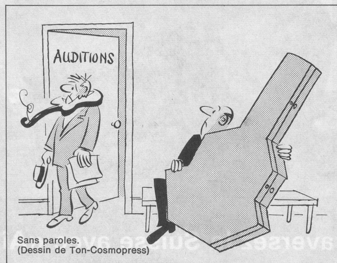
Sans paroles.