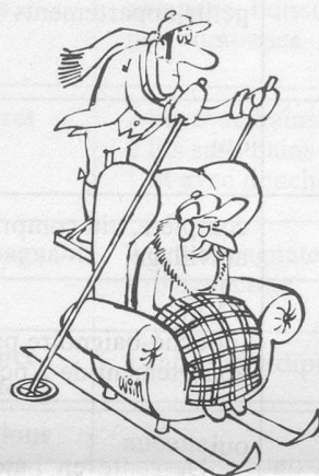
— Sans paroles. (Dessin de Moese-Cosmopress)

Dans la joie comme dans le [malheur. Et, de sa présence il l'illumine.