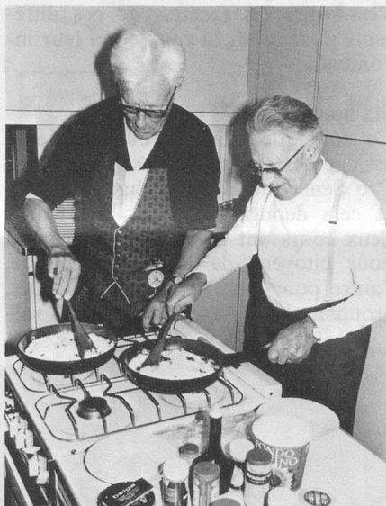
« Cela » donnera une délicieuse soupe à la farine agrémentée de petits croûtons croustillants.