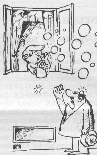
Sans paroles. (Dessin de Moese-Cosmopress)

Réd. Espérons que ces quelques lignes tomberont sous les yeux de ces heureux jeunes mariés qui ont bien mal commencé leur voyage de noces.