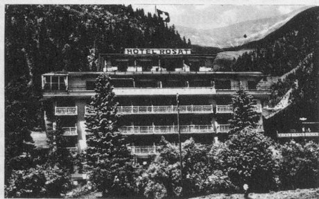
HOTEL ALPINA- ROSAT 1837 Château-d'Ex Altitude 1000 m. Tél. (029) 4 62 12

3, rue Mauborget (Bel-Air) — Tél. 021/22 99 47 LAUSANNE