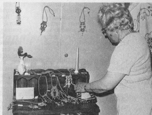
Vue, très partielle, des objets exposés.