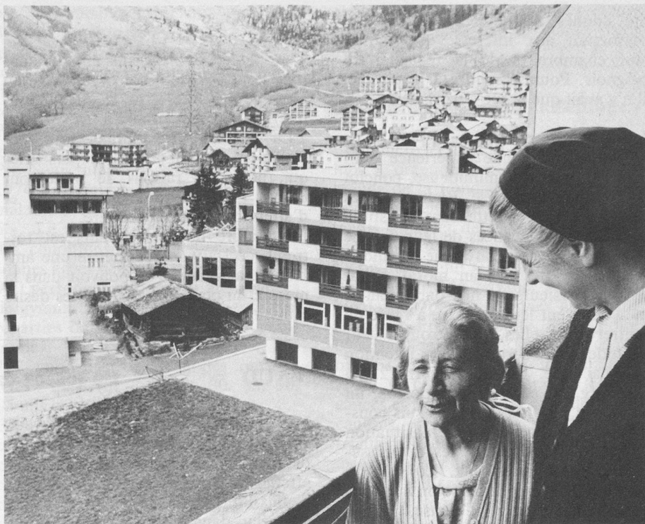
▲ Cure d'air sur les balcons de l'hôtel d'où la vue s'étend sur Loèche et les neiges de la Gemmi.