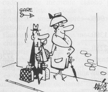
Sans paroles

L'affaiblissement de la mémoire, c'est prouvé, n'est pas nécessairement une conséquence de l'âge, mais, le plus souvent, un manque de volonté des gens âgés pour mémoriser des faits qui leur semblent moins intéressants. La curiosité pour la vie s'estompe ; on croit la connaître, et, présomptueusement, on pense n'avoir plus rien à apprendre. Ce qui est évidemment totalement faux. A n'importe quel âge, si l'on reste ouvert au monde et aux autres, on a tous les jours des sujets d'étonnement et de réflexion. « Vous n'avez pas de problèmes ? Alors cherchez-en ! » dit l'écrivain suisse Jakob Burckhardt.