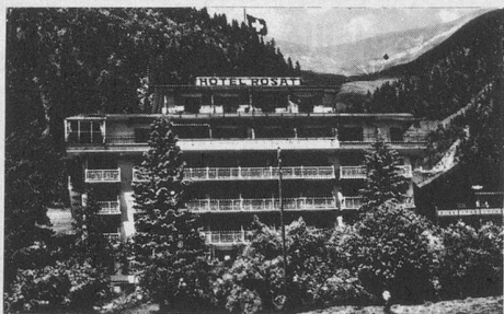
HOTEL ALPINA-ROSAT 1837 Château-d'Œx Altitude 1000 m. Té. (029) 4 62 12

« Jachète mieux », organe de la Fédération romande des consommatrices, à la suite de l'autorisation de l'Office vétérinaire fédéral d'introduire des polyphosphates dans les jambons et la charcuterie (en décembre 1972), a effectué un test sur 45 jambons. Seize dépassaient la norme permise. Le numéro d'avril vous apprend beaucoup de choses sur le jambon ainsi que sur le gaspillage de l'aluminium, du papier. Il vous donne aussi l'adresse des « magasins du monde » de Suisse romande. Vous ne connaissez pas les « magasins du monde » ? Ce sont des magasins qui veulent échapper aux circuits habituels du commerce pour apporter une aide efficace au tiers monde. Ils offrent, en quantités limitées, des produits alimentaires (café et thé, par exemple), des livres sérieux concernant le tiers monde et des articles artisanaux venant de Recife (Brésil) sur l'initiative du Mouvement populaire des familles. Une initiative intelligente qu'il vaut la peine d'encourager.