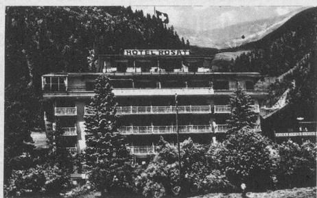
HOTEL ALPINA-ROSAT 1837 Château-d'Œx Altitude 1000 m. Té. (029) 4 62 12

« Jachète mieux », organe de la Fédération romande des consommatrices, à la suite de l'autorisation de l'Office vétérinaire fédéral d'introduire des polyphosphates dans les jambons et la charcuterie (en décembre 1972), a effectué un test sur 45 jambons. Seize dépassaient la norme permise. Le numéro d'avril vous apprend beaucoup de choses sur le jambon ainsi que sur le gaspillage de l'aluminium, du papier. Il vous donne aussi l'adresse des « magasins du monde » de Suisse romande. Vous ne connaissez pas les « magasins du monde » ? Ce sont des magasins qui veulent échapper aux circuits habituels du commerce pour apporter une aide efficace au tiers monde. Ils offrent, en quantités limitées, des produits alimentaires (café et thé, par exemple), des livres sérieux concernant le tiers monde et des articles artisanaux venant de Recife (Brésil) sur l'initiative du Mouvement populaire des familles. Une initiative intelligente qu'il vaut la peine d'encourager.