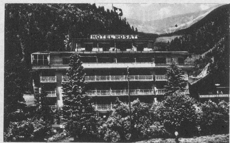
HOTEL ALPINA-ROSAT 1837 Château-d'Oex Altitude 1000 m. Tél. (029) 4 62 12

« Jachète mieux », organe de la Fédération romande des consommatrices, à la suite de l'autorisation de l'Office vétérinaire fédéral d'introduire des polyphosphates dans les jambons et la charcuterie (en décembre 1972), a effectué un test sur 45 jambons. Seize dépassaient la norme permise. Le numéro d'avril vous apprend beaucoup de choses sur le jambon ainsi que sur le gaspillage de l'aluminium, du papier. Il vous donne aussi l'adresse des « magasins du monde » de Suisse romande. Vous ne connaissez pas les « magasins du monde » ? Ce sont des magasins qui veulent échapper aux circuits habituels du commerce pour apporter une aide efficace au tiers monde. Ils offrent, en quantités limitées, des produits alimentaires (café et thé, par exemple), des livres sérieux concernant le tiers monde et des articles artisanaux venant de Recife (Brésil) sur l'initiative du Mouvement populaire des familles. Une initiative intelligente qu'il vaut la peine d'encourager.