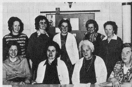
Les neuf aides ménagères