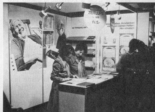
Des hôtesse souriantes.