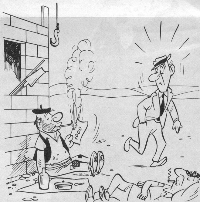
Sans paroles (Dessin de Sabatès).