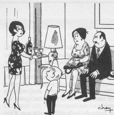
Invitez-les à dîner : ils nous aideront à finir les nouilles de midi (Dessin de Chen-Cosmopress)

Théâtre — Le 28 février, à 14 h. 30, au Théâtre municipal : « La Toile d'Araignée » d'Agatha Christie. Une pièce à suspense admirablement jouée.