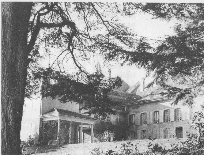
Le château de Constantine, trois fois séculaire.