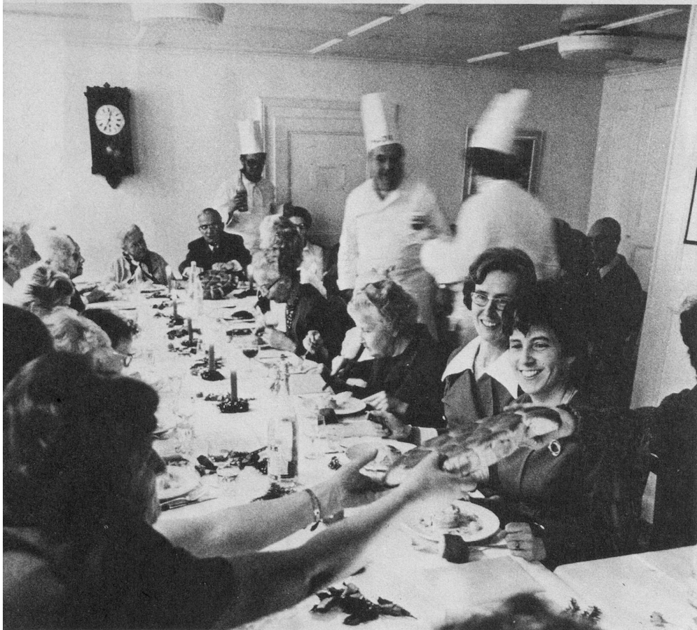
Les « Potes au feu » servent, les directrices sont heureuses.

qui souvent occupent la cuisine familiale dès le vendredi soir. Les dames ne sont admises que comme invitées à la table, les cuisiniers professionnels que comme « conseillers techniques amicaux ». Les « Potes au feu » proviennent de toutes les professions, du médecin au fonctionnaire ; sous le tablier, il n'y a pas de différence, et devant la casserole, ils sont tous frères.