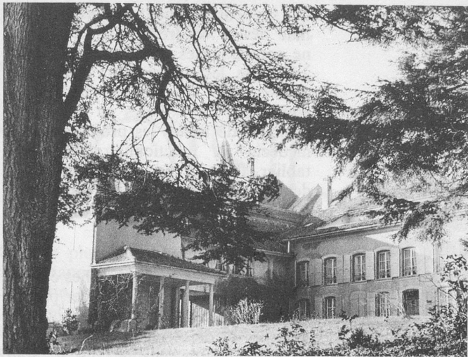
Le château de Constantine, trois fois séculaire.