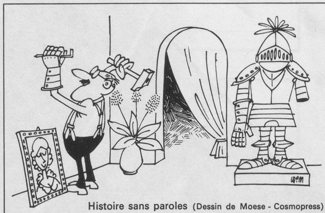
Histoire sans paroles (Dessin de Moese - Cosmopress)