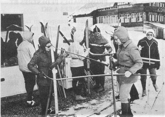
Séance de fartage avant le départ.