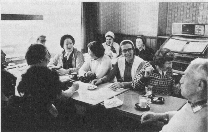
Les «joues rouges» se réchauffent dans un accueillant café.