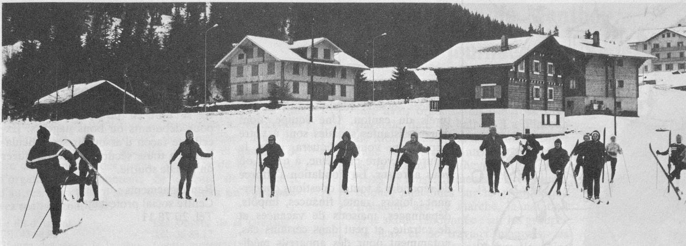
Avant la balade, exercices pour se chauffer les muscles.