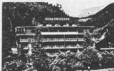
HOTEL ALPINA-ROSAT 1837 Château-d'Œx Altitude 1000 m. Tél. (029) 4 62 12

Lausanne : rue Pichard 9 (021) 22 81 91 Genève : Longemalle 7/Port 4 (022) 21 28 14 Neuchâtel : Fbg de l'Hôpital 26 (038) 24 10 20 Sion : Av. de la Gare 21 (027) 2 70 58 Fribourg : rue St-Pierre 26 (037) 23 22 95