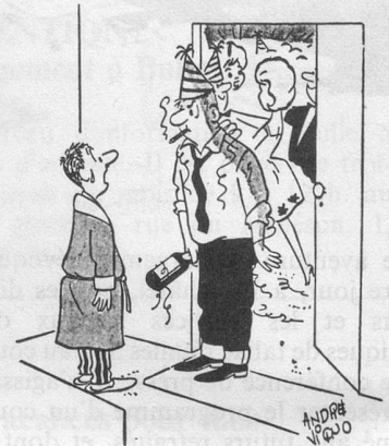
Euh! En entendant du bruit, je me suis dit: « Je vais leur souhaiter une bonne année... » (Dessin de Vigno-Cosmopress)