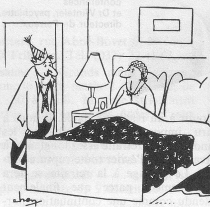
Tu appelles ça bien commencer l'année? (Dessin de Chen-Cosmopress)