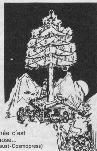
Chaque année c'est la même chose... (Dessin de Faust-Cosmopress)

Piquez une orange de clous de girofle. Ce hérisson amusant embaume toute l'année et même plus longtemps. Attention ! Faites vos hérissons à l'avance : certaines oranges pourrissent au lieu de sécher.