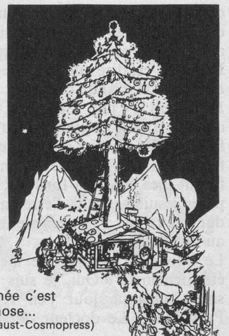
Chaque année c'est la même chose... (Dessin de Faust-Cosmopress)

Piquez une orange de clous de girofle. Ce hérisson amusant embaume toute l'année et même plus longtemps. Attention ! Faites vos hérissons à l'avance : certaines oranges pourrissent au lieu de sécher.