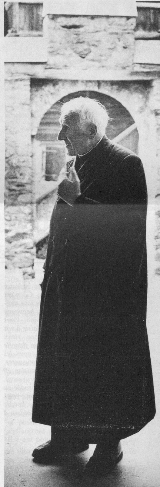
Un géant de 89 ans, droit comme un i.

A chaque fois je me sens délivré, plus léger... Certains trouvent que je suis trop vieux et que je devrais renoncer à mon ministère. Mais je ne démissionnerai que quand j'y serai obligé. Mes