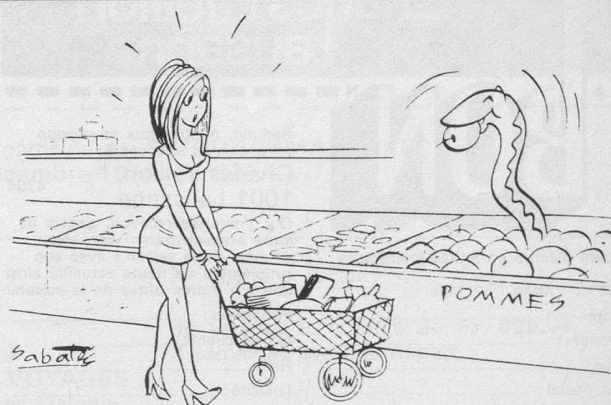
Histoire sans paroles.

Pour tous renseignements et visite s'adresser à: GÉRANCE DES IMMEUBLES DUBIED rue du Musée 1, 2001 Neuchâtel - tél. 038 25 75 22, interne 81