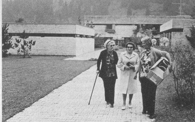
Moderne, fonctionnel, accueillant, tel est le Centre de Sornetan, lieu de rencontres, lieu de vacances.

De telles discussions, bien menées, provoquées par des questions clairement posées, ne laissent personne indifférent. Elles sont passionnantes, animées, enrichissantes, et le dialogue