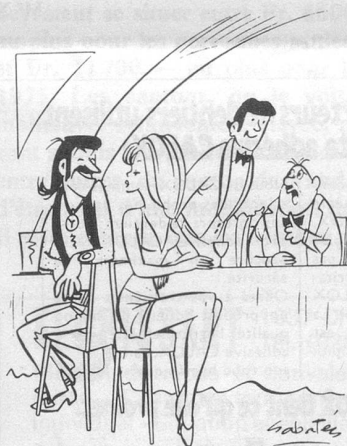
Garçon... faites des additions séparées, s.v.p.!