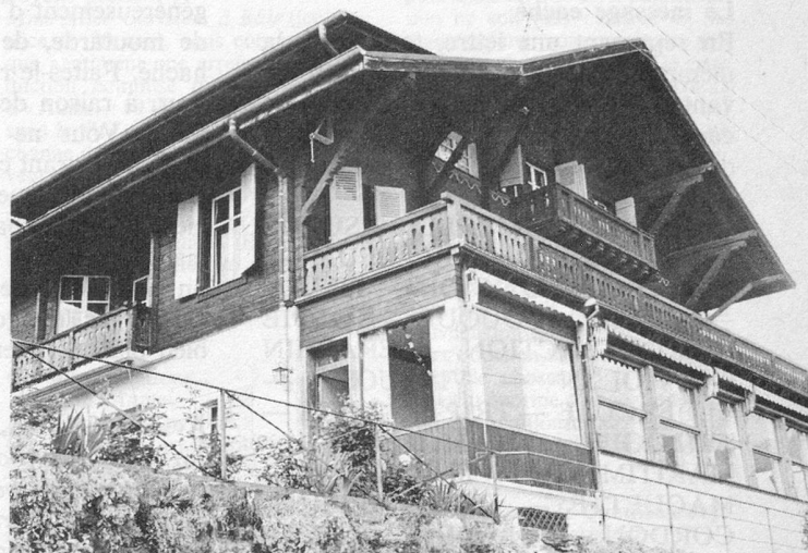
L'Hôtel de la Toison d'Or à Gryon. Un grand chalet confortable au soleil...

Ces prix pour la pension complète, ne comprennent pas le voyage. Le nombre de places disponibles étant limité, il est conseillé aux personnes que cette offre intéresse de s'annoncer dès que possible en demandant un bulletin d'inscription aux Secrétariats cantonaux de Pro Senectute. Les adresses de ces secrétariats figurent en tête de la page 15 de ce numéro.