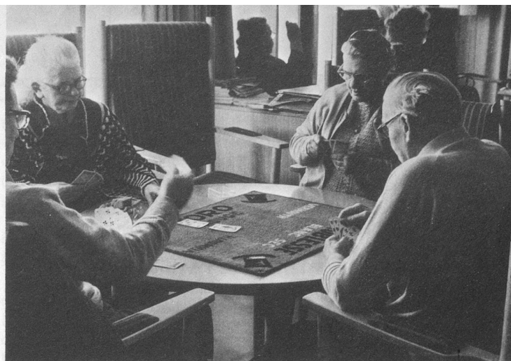
La partie de cartes: le temps coule...