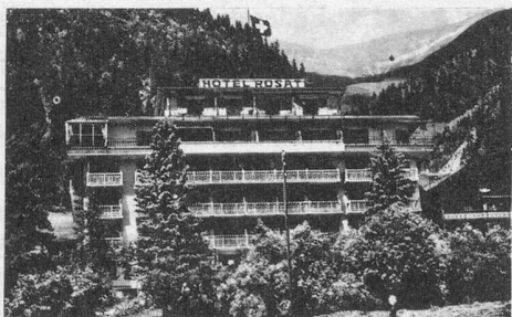
HOTEL ROSAT 1837 Château-d'Ex Altitude 1000 m. Tél. (029) 4 62 12

Cadre tranquille et agréable Grand parc, vue imprenable Idéal pour repos et convalescence - Tout confort - Lift Cuisine très soignée - Sur demande, cuisine à régimes