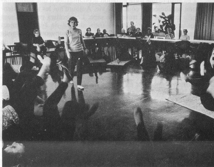
Etre et demeurer en forme.