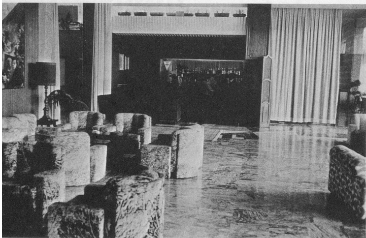
De vastes salons au confort raffiné.