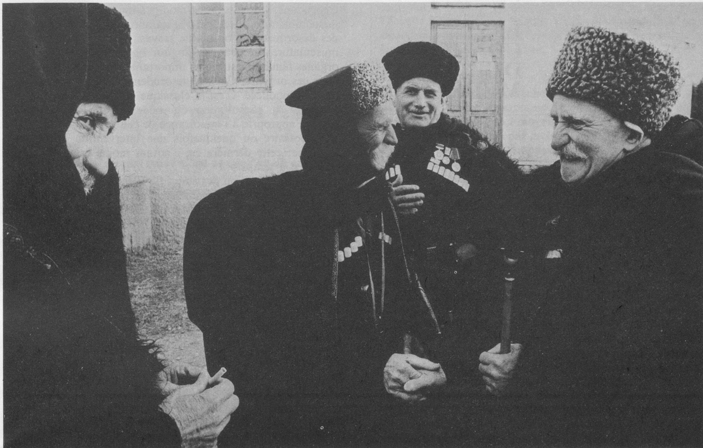
Les centenaires du Caucase vous accueilleront.

rencontre avec les centenaires; toutes les excursions à Moscou, la pension complète (3 repas par jour), le logement en chambres à 2 lits, la soirée théâtrale à Moscou, les services d'un guide parlant français, les taxes d'aéroport, les porteurs, les assurances pour perte ou vol de bagages pour Fr. 2000.—, les assurances pour frais d'annulation ou de retour prématuré en cas de nécessité. Quelques excursions supplémentaires à départ de Sotchi sont possibles (non comprises dans le prix): visite de Sotchi Fr. 15.—; excursion au mont Akhoun Fr. 15.—; visite du bois d'If Fr. 15.—; excursion au lac Ritza Fr. 46.—, soirée au Restaurant «Aoul du Caucase» avec repas (spécialités géorgiennes) Fr. 46.—.