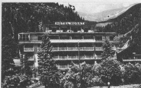
HOTEL ROSAT 1837 Château-d'Œx Altitude 1000 m. Tél. (029) 4 62 12