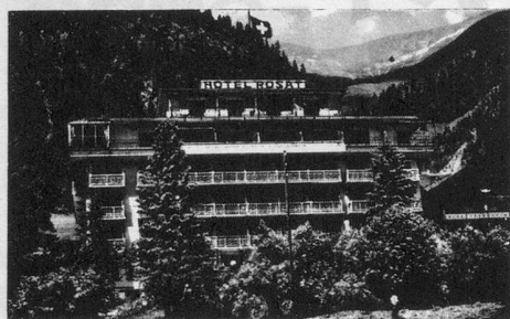
HOTEL ROSAT 1837 Château-d'Oex Altitude 1000 m. Tél. (029) 4 62 12

Le médecin consulté à temps va s'apercevoir que la prostate est un peu grosse, généralement la partie droite de cette prostate ayant augmenté de volume. A ce stade, il est possible encore par un traitement médicamenteux d'essayer d'empêcher l'évolution de la maladie. Un traitement suivi régulièrement par des extraits glandulaires permet de limiter ou de contrôler l'évolution de cette hypertrophie de la prostate.