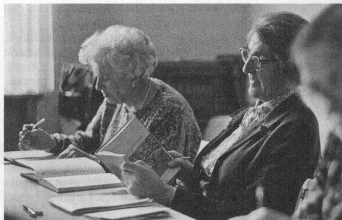
La leçon d'anglais. Apprendre une langue? Pourquoi pas? Cela ouvre de nouvelles perspectives.

La Fondation Pour la Vieillesse recommande à tous les milieux qui, sous une forme ou une autre, s'occupent de la formation des adultes, d'introduire cette nouvelle discipline dans leur programme d'activité. Ils peuvent se renseigner à ce sujet au centre régional compétent de la Fondation Pour la Vieillesse (Pro Senectute).