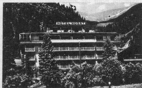
HOTEL ROSAT 1837 Château-d'Œx Altitude 1000 m. Tél. (029) 4 62 12

Cadre tranquille et agréable Grand parc, vue imprenable Idéal pour repos et convalescence - Tout confort - Lift Cuisine très soignée - Sur demande, cuisine à régimes