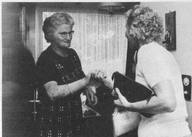
Flash sur le service saint-gallois de repas à domicile

... que Pro Senectute est actuellement en train d'effectuer une vaste enquête sur tous les logements et établissements pour personnes âgées, existant en Suisse?