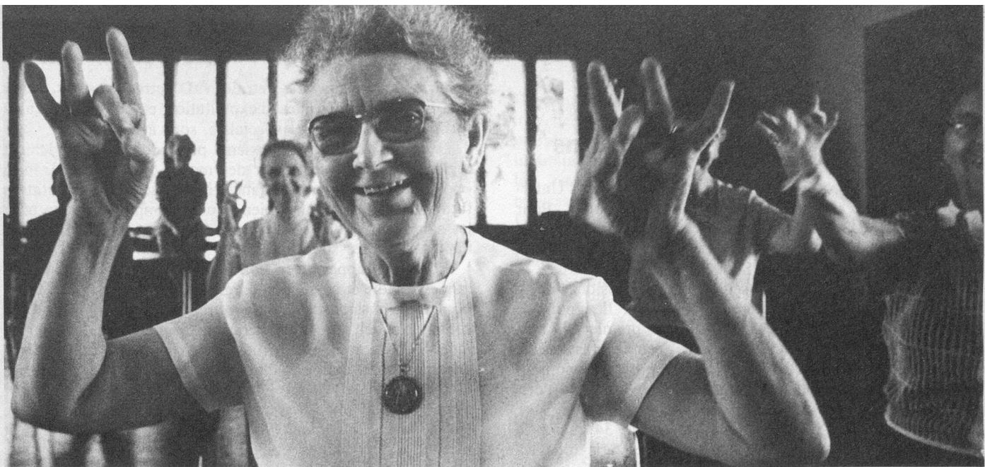
Le mouvement du corps est aussi synonyme de joie de vivre.