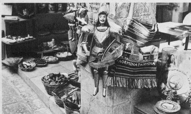
Mille souvenirs, partout, de vos vacances siciliennes.

A Naxos, deux hôtels sont à votre disposition. Ils sont des plus accueillants et confortables. Le Kalos , un peu plus luxueux que le Nike , possède un ascenseur. Il est donc plus spécialement destiné aux personnes se déplaçant avec difficulté. Son prix est un peu plus élevé que celui du Nike qui est également un établissement très plaisant. Toutes les chambres sans exception sont à deux lits, avec douche, WC privés. La nourriture est excellente, variée, abondante. Les locaux communs (salon, bar, salle de TV) du Kalos et du Nike sont des plus sympathiques et d'un goût sans reproche.