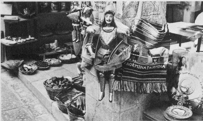
Mille souvenirs, partout, de vos vacances siciliennes.

A Naxos, deux hôtels sont à votre disposition. Ils sont des plus accueillants et confortables. Le Kalos , un peu plus luxueux que le Nike , possède un ascenseur. Il est donc plus spécialement destiné aux personnes se déplaçant avec difficulté. Son prix est un peu plus élevé que celui du Nike qui est également un établissement très plaisant. Toutes les chambres sans exception sont à deux lits, avec douche, WC privés. La nourriture est excellente, variée, abondante. Les locaux communs (salon, bar, salle de TV) du Kalos et du Nike sont des plus sympathiques et d'un goût sans reproche.