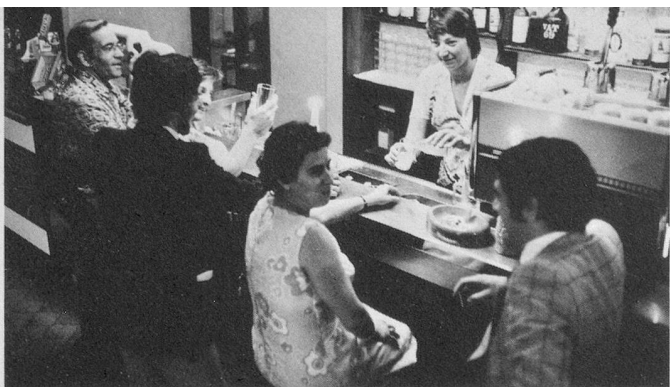
Confort, délassement: le bar du Nike.