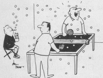
Fernande! Appelle le gosse avant que je pique une crise de nerfs! (Dessin de Faure-Cosmopress)

est vital pour elle de ne prêter le flanc à aucune critique, à aucune suspicion. La loterie doit être, et elle est, du super-sérieux, du cousu-main. Ce qui n'exclut nullement la bonne humeur.