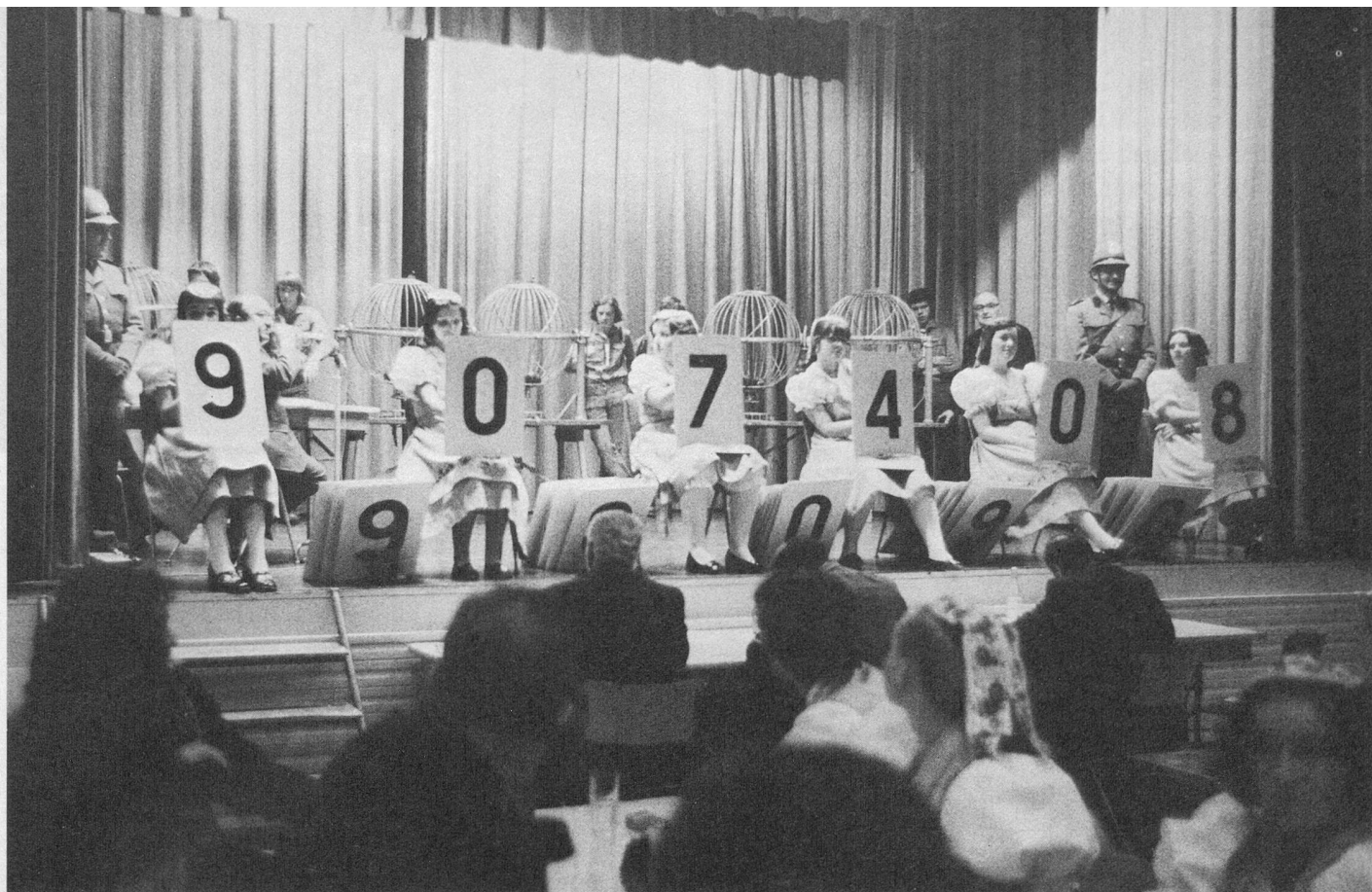
Les jeunes filles du groupe folklorique «Fil du Temps» présentent les numéros du bonheur.