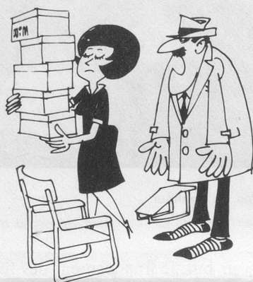
Mais je suis tout à fait sûr d'être arrivé chez vous avec des souliers! (Dessin de Moëse-Cosmopress)