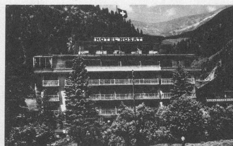
HOTEL ROSAT 1837 Château-d'Œx Altitude 1000 m. Tél. (029) 4 62 12

Cadre tranquille et agréable Grand parc, vue imprenable Idéal pour repos et convalescence - Tout confort - Lift Cuisine très soignée - Sur demande, cuisine à régimes