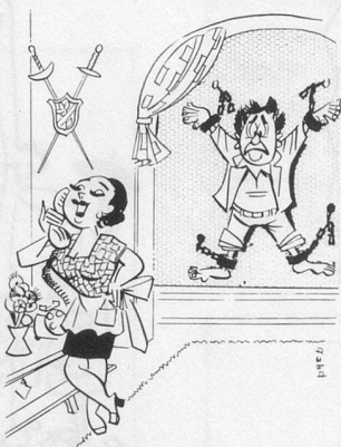
— Nous sommes fermement pour la protection de la nature. Exemple: mon mari ne fume plus depuis trois semaines...