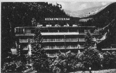
HOTEL ALPINA-ROSAT 1837 Château-d'Œx Altitude 1000 m. Tél. (029) 4 62 12

(Voir reportage dans « Aînés » n° 4 - page 10)