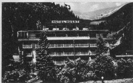
HOTEL ALPINA-ROSAT 1837 Château-d'Œx Altitude 1000 m. Tél. (029) 4 62 12

(Voir reportage dans « Aînés » n° 4 - page 10)