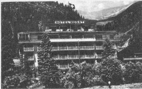
HOTEL ALPINA-ROSAT 1837 Château-d'Œx Altitude 1000 m. Tél. (029) 4 62 12

Cadre tranquille et agréable Grand parc, vue imprenable Idéal pour repos et convalescence - Tout confort - Lift Cuisine très soignée - Sur demande, cuisine à régimes