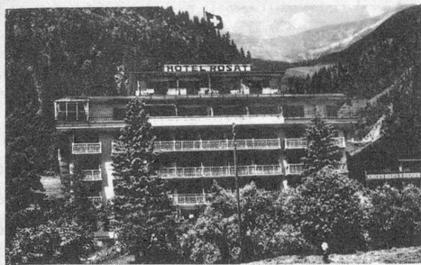
HOTEL ALPINA-ROSAT 1837 Château-d'Œx Altitude 1000 m. Tél. (029) 4 62 12

Cadre tranquille et agréable Grand parc, vue imprenable Idéal pour repos et conva- lescence - Tout confort - Lift Cuisine très soignée - Sur demande, cuisine à régimes