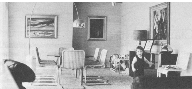
Des spots orientables ont remplacé les bacs de néon. Ils permettent d'éclairer la terrasse et les tableaux.